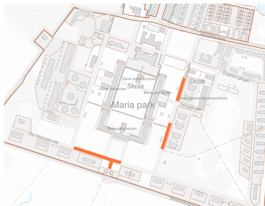
Generaliserad skiss över asfalteringsarbete

Under 2023 planerar vi att genomföra stora asfalteringsarbeten. Det gäller främst delar av Carl Westmans Allé och delar av Östra Allén.